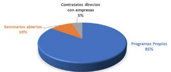
GRÁFICA IX-A ACTIVIDADES REALIZADAS EN 2018 POR EL CFE (EN PORCENTAJES)

En cuanto a personas capacitadas, se alcanzó un total de 8, 214, de las cuales 4,628 fueron hombres, y 3,586, mujeres.