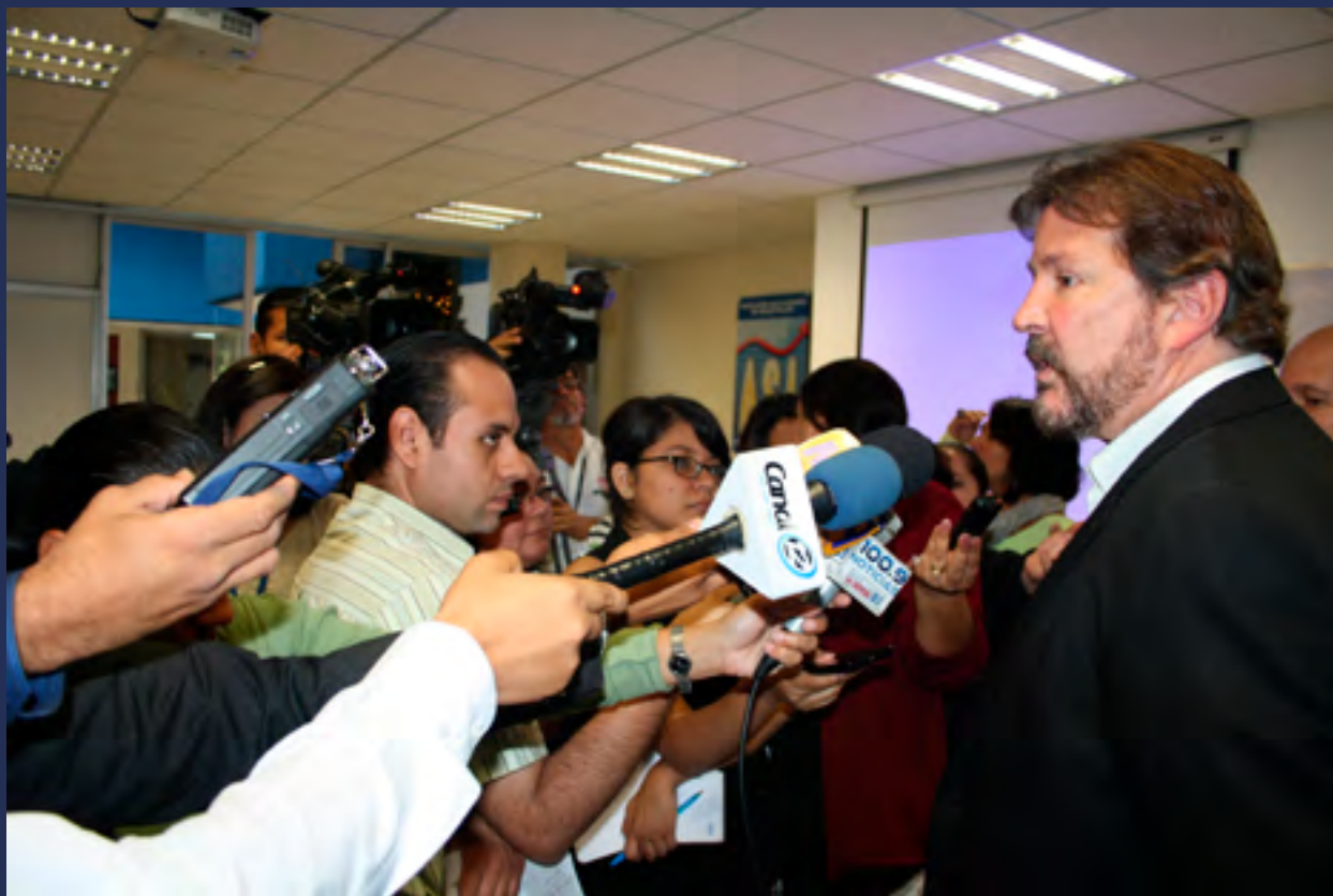
OPINIÓN. Las opiniones de los voceros ante los medios informativos contribuyeron a posicionar a la Cámara como la primera fuente gremial de noticias de El Salvador