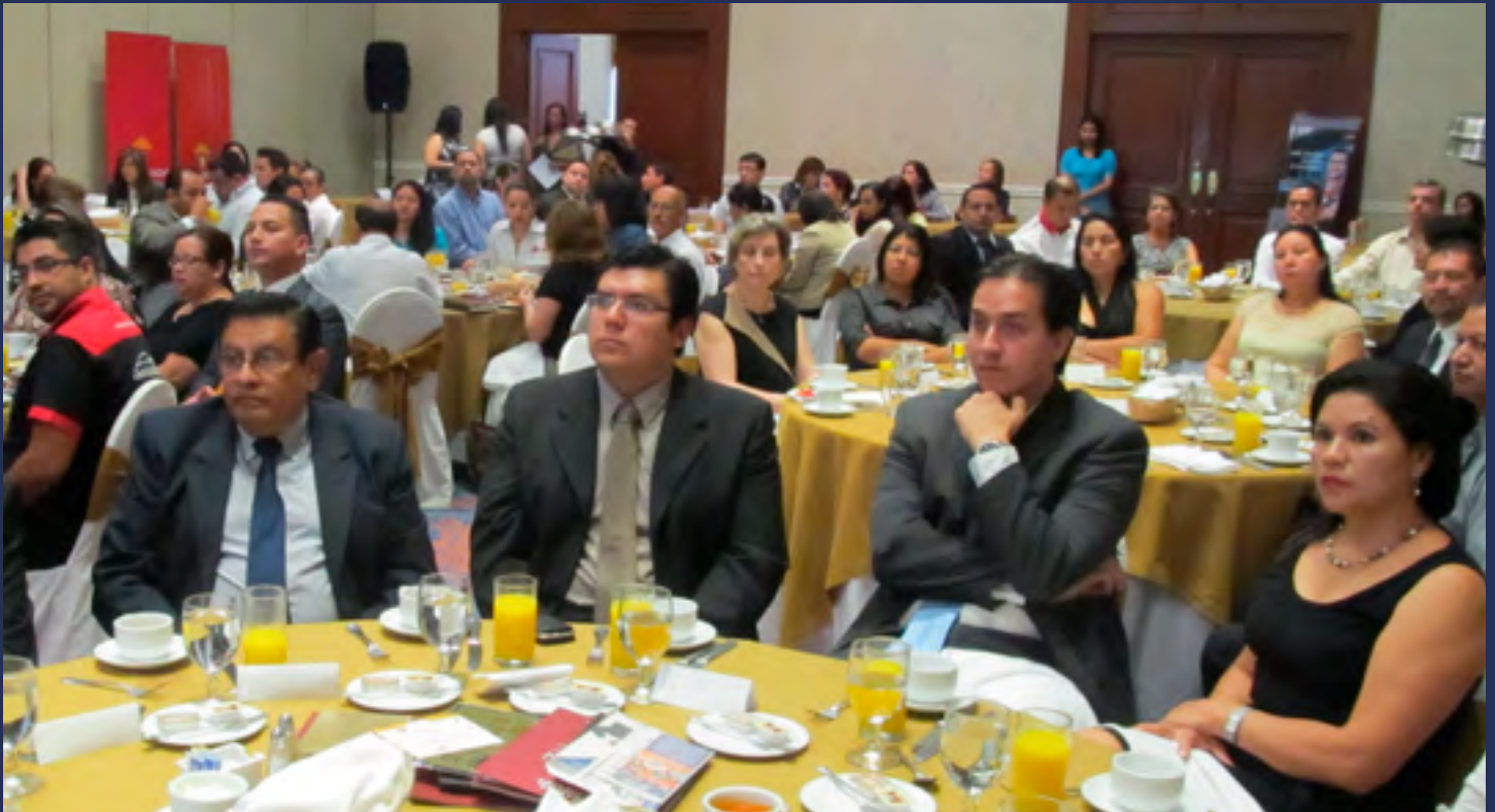
INTERCAMBIOS. El Comité de Comercio organizó doce encuentros empresariales en todo el país, de los cuales seis se llevaron a cabo en San Salvador