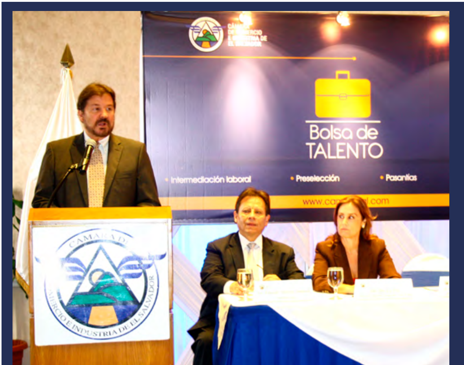
NUEVOS SERVICIOS. La Bolsa de Talento Humano es uno de los nuevos servicios creados en 2014

Mediante un acuerdo con el Programa de Voluntarios del Programa de Cooperación Internacional del Japón JICA, se cuenta con un consultor experto en tema de exportación, importación y mercadeo internacional, quien está apoyando directamente a empresas socias en la identificación de su potencial exportador, principalmente enfocado en el mercado asiático.