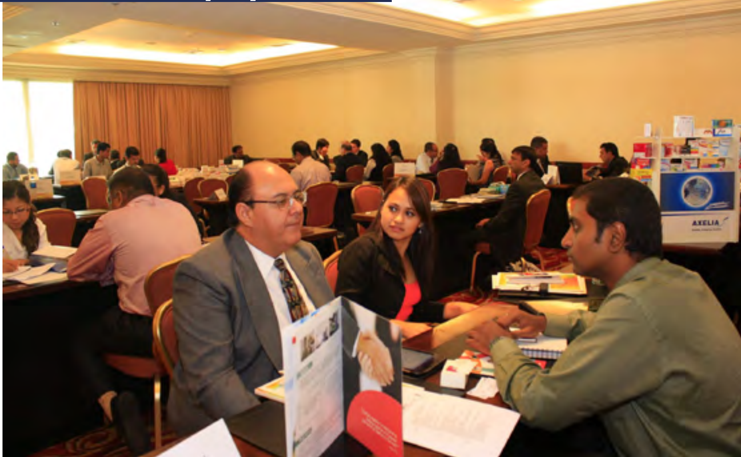
NEGOCIOS. Se realizaron ruedas de negocios con delegaciones comerciales extranjeras

En el 2014 inició la aplicación del Programa Regional de Formación de Emprendedores (EMPRENDES), con apoyo del Programa Facilidad ejecutado por GIZ. EMPRENDES tiene cobertura regional en Honduras, Guatemala y El Salvador, y tiene por objetivo contribuir a la dinamización de las economías de la región por medio de la implementación de un modelo de formación, asesoría y vinculación que posibilite el establecimiento de nuevas empresas.