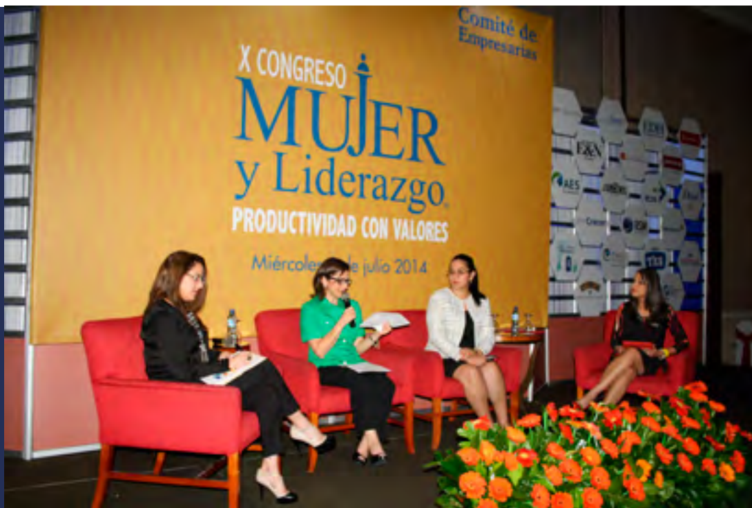
LIDERAZGO. El fomento del liderazgo y el emprendedurismo femenino fue una de las principales apuestas del Comité de Empresarias