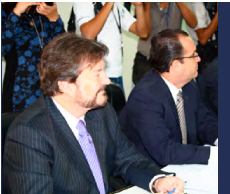
DIÁLOGO. En abril, la Cámara participó en las reuniones de diálogo entre la cúpula empresarial y miembros el gabinete del gobierno electo

En octubre, se realizó una reunión con representantes de los sectores afectados por el Sistema de Transporte de Área Metropolitana de San Salvador (SITRAMSS), en donde se conoció que el Ministerio de Obras Públicas había reconocido el mal diseño del proyecto desde sus inicios. La información obtenida en dicha reunión sirvió como insumo para denunciar el efecto que dicho proyecto de transporte público ha tenido en las empresas situadas en sus cercanías.