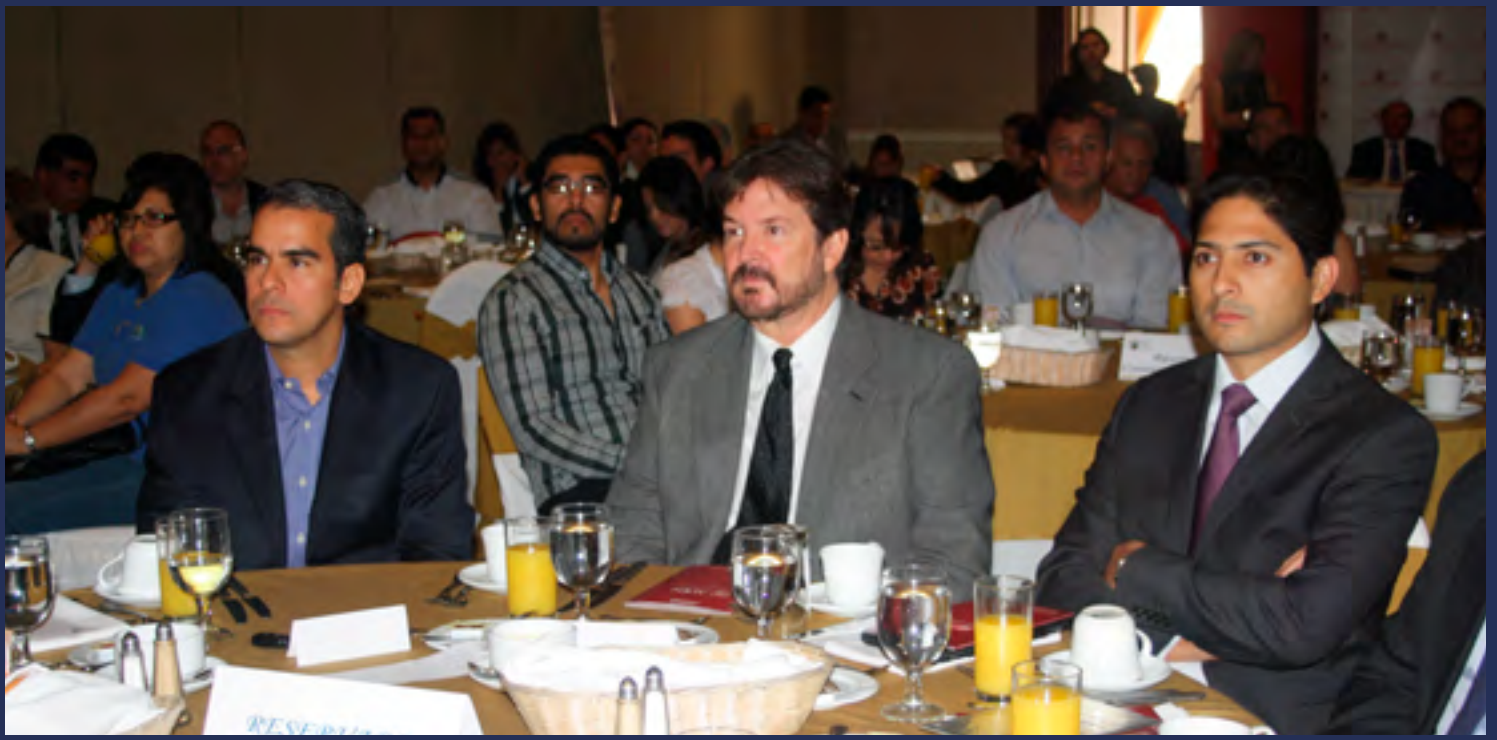
ENCUENTROS EMPRESARIALES. Se realizaron trece Encuentros Empresariales en los que participaron seiscientos sesenta personas de 558 empresas socias