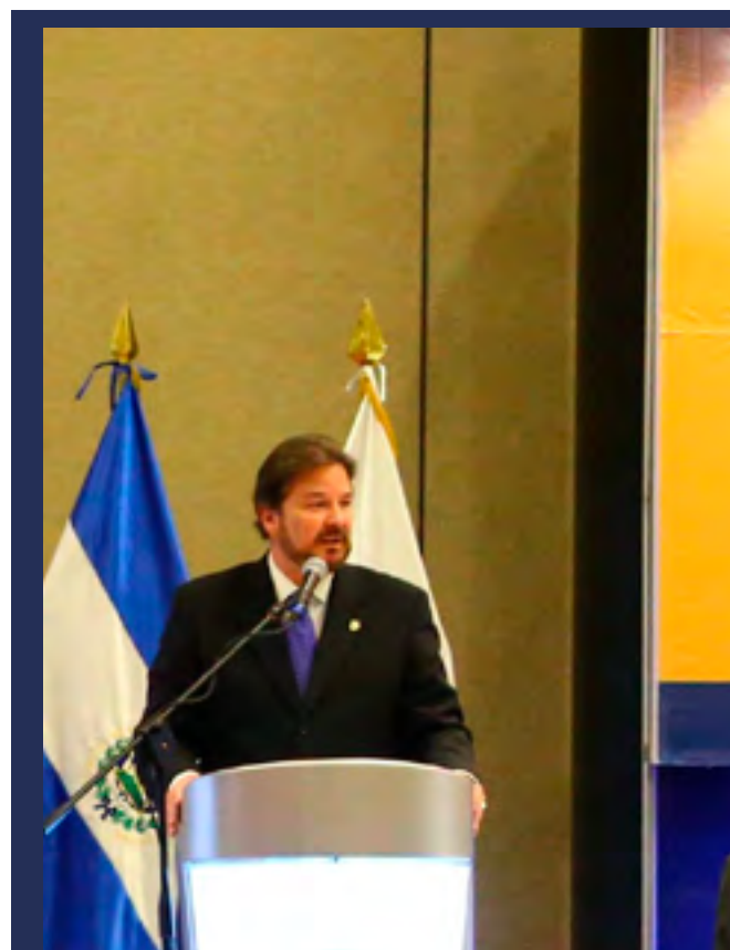
Presidente de la Cámara de Comercio e Industria de El Salvador