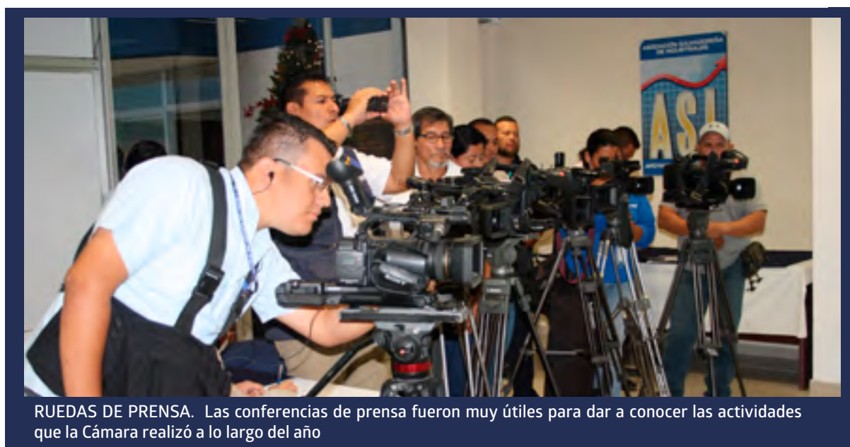
RUEDAS DE PRENSA. Las conferencias de prensa fueron muy útiles para dar a conocer las actividades que la Cámara realizó a lo largo del año

NOTA: Los datos no incluyen las noticias ni campos pagados generados por las sedes Regionales.