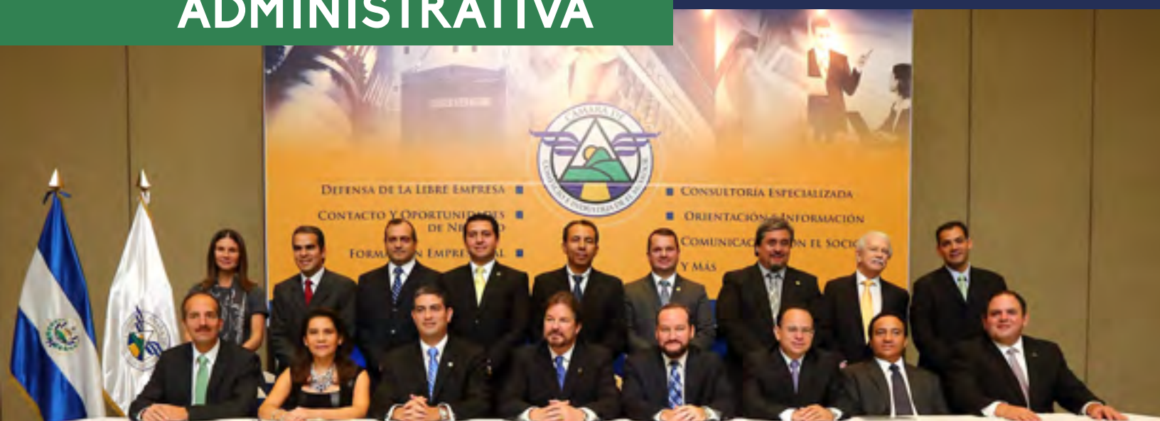
Junta Directiva de la Cámara de Comercio e Industria de El Salvador para el periodo febrero 2014-febrero 2015