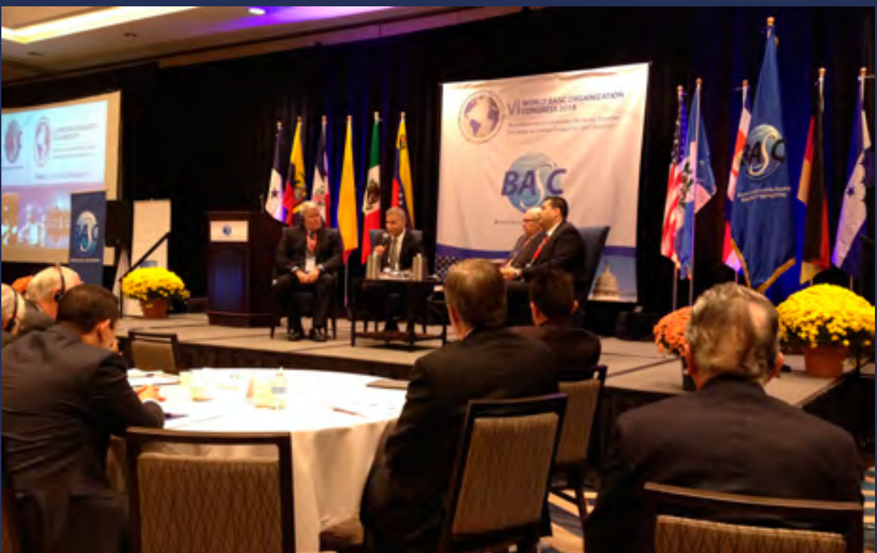
INTERNACIONALIZACIÓN. En octubre se participó en el VI Congreso Mundial de la Organización Mundial BASC, realizado en Washington, Estados Unidos