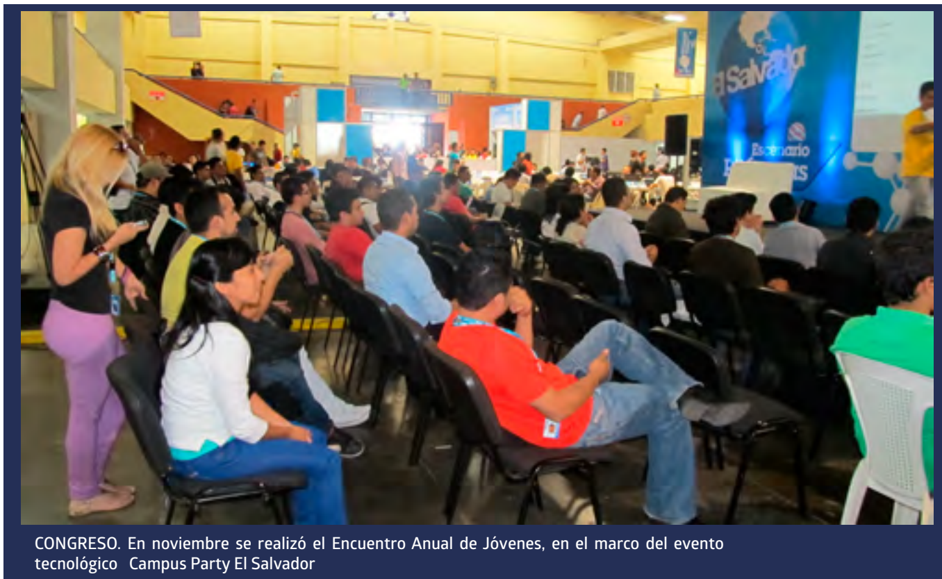
CONGRESO. En noviembre se realizó el Encuentro Anual de Jóvenes, en el marco del evento tecnológico Campus Party El Salvador