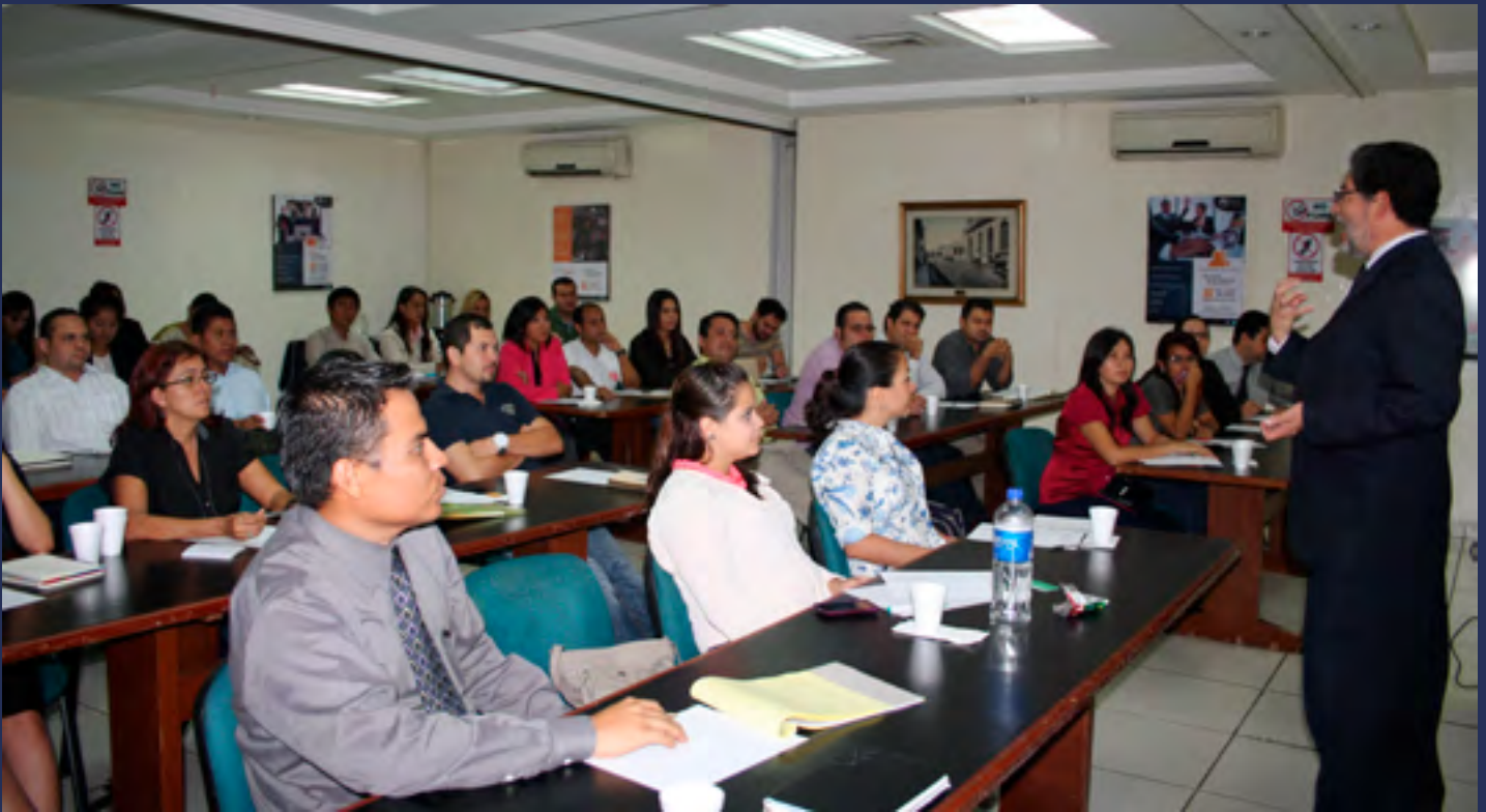
CAPACITACIÓN. Se realizaron 290 actividades de capacitación beneficiando a 10 097 personas en todo el país