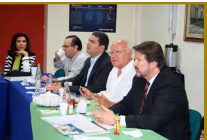
ANÁLISIS. A lo largo del año, se sostuvieron reuniones con especialistas en diferentes materias y con analistas de la realidad nacional

En octubre se participó en una de las mesas de trabajo del Consejo de Seguridad y Convivencia Ciudadana en la que se hizo ver el mal uso de los recursos en el tema de seguridad. En la mesa de trabajo MIPYME se solicitó conocer la Política de Seguridad y la elaboración de un plan antes de buscar alternativas de financiamiento.