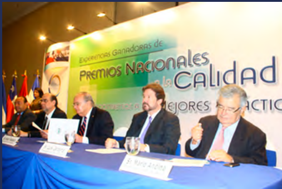
DÍALOGO. En abril, la Cámara participó en las reuniones de diálogo entre la cúpula empresarial y miembros del gabinete del gobierno electo