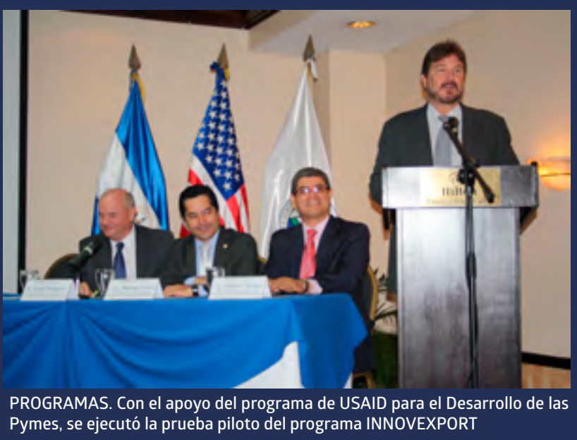
PROGRAMAS. Con el apoyo del programa de USAID para el Desarrollo de las Pymes, se ejecutó la prueba piloto del programa INNOVEXPORT

Con el apoyo del programa de USAID para el Desarrollo de las Pyme, se ejecutó la prueba piloto del programa INNOVEXPORT. El programa piloto acompañó a doce empresas en este proceso: ocho del sector farmacéutico (Laboratorios INHOSPI, VIDES, HEALTHCO, COFASA, POLYPHARMA, SOPERQUIMIA, PHARMASION y Laboratorios S y M), dos empresas veterinarias (Laboratorios PHARMAPEC e Innovaciones Nutricionales), una empresa de alimentos (Sabor Amigo), y una empresa química industrial (BOLPLAN).